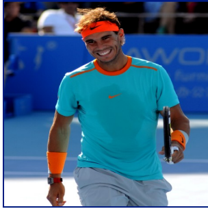
Rafael Nadal (tenista)