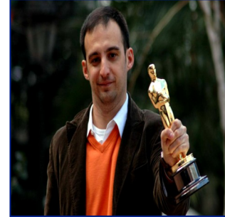
Alejandro Amenábar (director de cine)