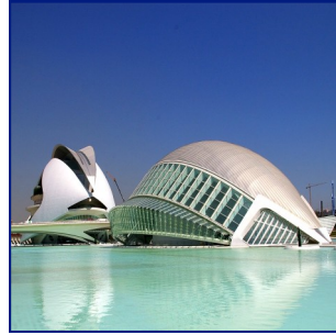
Obra del arquitecto Santiago Calatrava (Valencia)