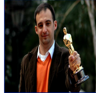
Alejandro Amenábar (metteur en scène)