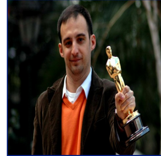
Alejandro Amenábar (regisseur)