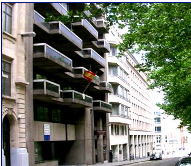
Consejería de Educación in België, Nederland en Luxemburg (Bureau in Brussel)