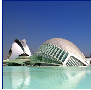
Bouwwerk van architect Santiago Calatrava (Valencia)