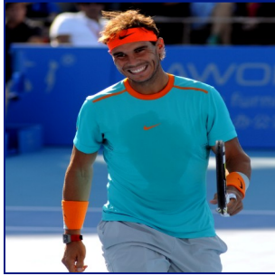
Rafael Nadal (tennisser)