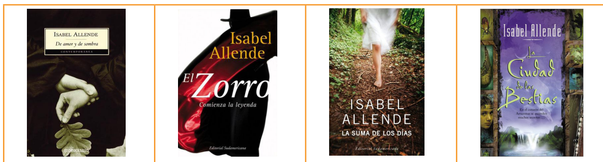
a) De amor y de sombra b) El Zorro c) La suma de los días d) La ciudad de las bestias

Para ver y escuchar a Isabel Allende ver en recursos gratuitos del Ministerio de Educación de España el vídeo: http://recursostic.educacion.es/bancoimagenes/web/