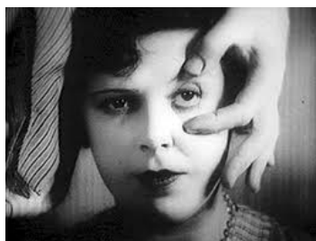
Fig. 1: fotograma del ojo que está a punto de ser cortado ( Un perro andaluz , 1929)

La primera, que se realiza antes de ver Un perro andaluz , consiste en la presentación a la clase de una brevísima vídeo-entrevista a Luis Buñuel 10 , en francés, pero subtitulada en inglés, que permite trabajar también en una clase multilingüe usando el español como lengua de enseñanza y explicación y el inglés como idioma intermedio de comunicación. La entrevista es significativa porque ofrece la oportunidad al docente de contextualizar algunas imágenes y elecciones de argumentos que podrían resultar oscuros o absurdos a los alumnos. En particular el director aragonés explica la importancia del sueño en el interior del corto, añadiendo que el guión – escrito en siete días – se basó de manera especial sobre “deux rêves”: uno de Dalí, que había soñado con su mano llena de hormigas y el otro suyo, en el que se había figurado la imagen – cult hoy en día – de un cuchillo que cortaba un ojo humano: