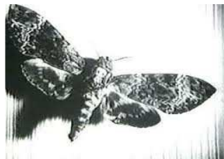
Fig. 2: fotograma de la mariposa calavera ( Un perro andaluz , 1929)

Después de la visualización de Un perro andaluz se propone una tarea en pequeños grupos con el objetivo de investigar sobre la presencia, en la filmografía posterior, de algunas escenas significativas del cortometraje. En particular nos referimos al fotograma en el que Buñuel, con una cuchilla de afeitar, corta un ojo a la actriz (min. 01.10) (fig. 1) y a la imagen de la mariposa calavera, utilizada en uno de los planos más recordados de la obra maestra (min. 13.11) (fig. 2) 13 .