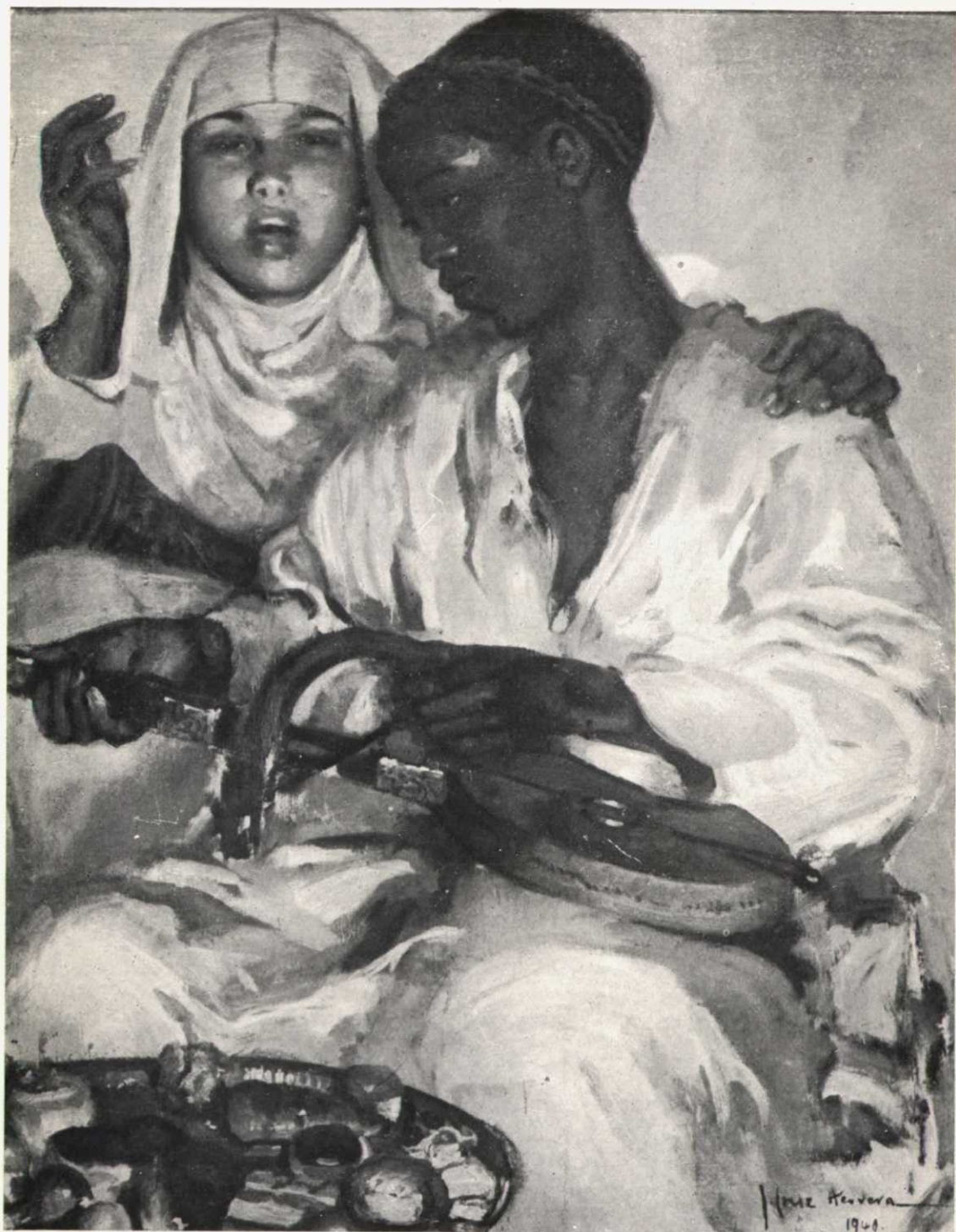
«Músicos árabes», de José Cruz Herrera.