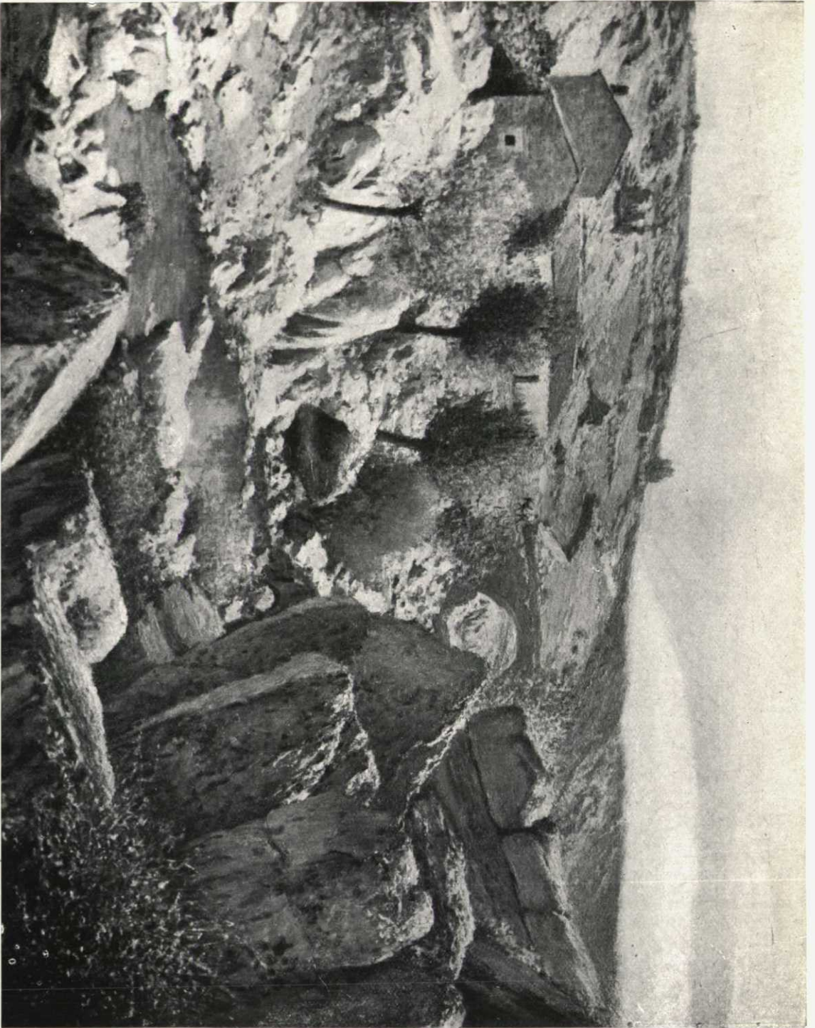
«Contorno de un viejo molino», de Emilio García Martínez.