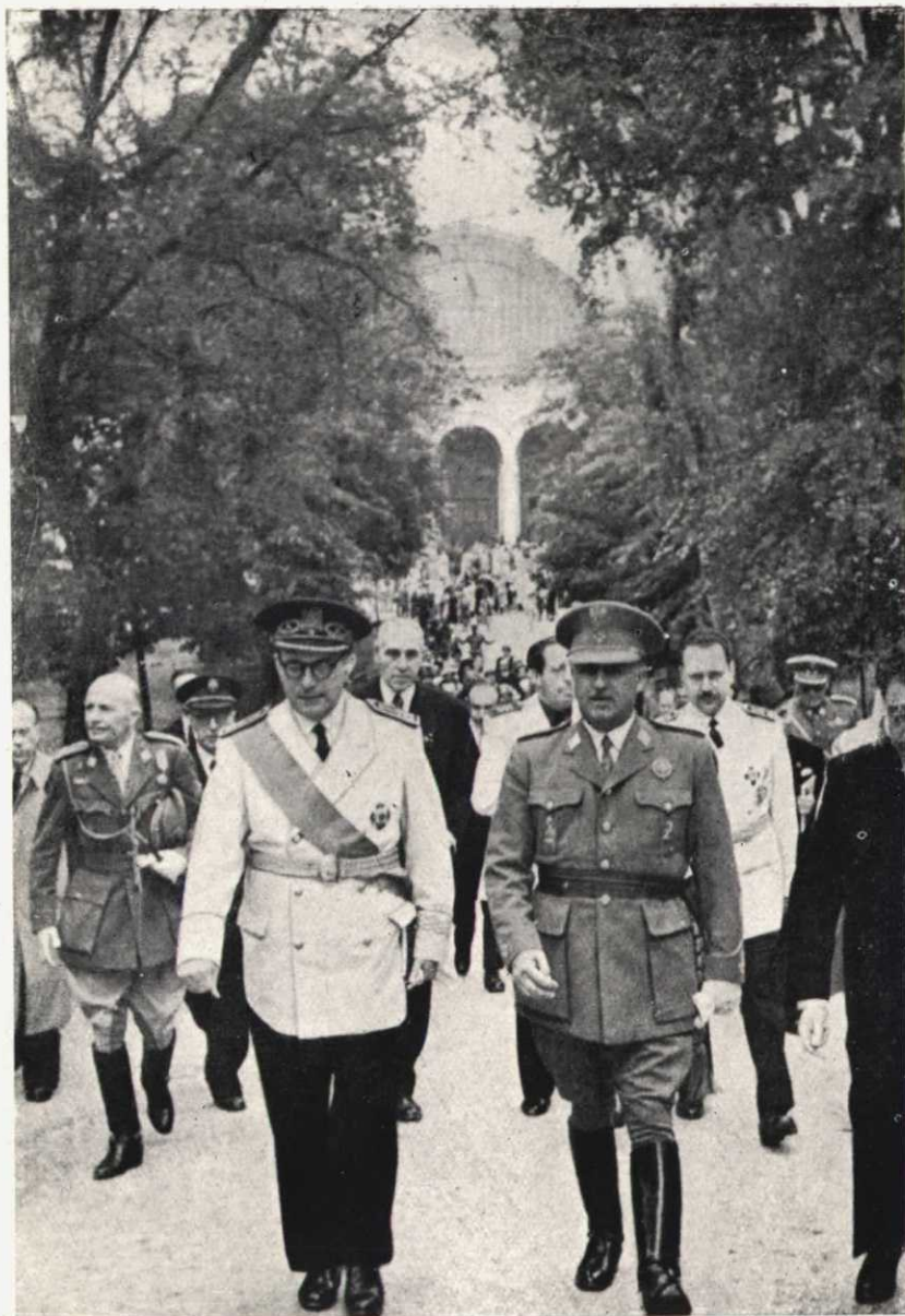
S. E. el Jefe del Estado, acompañado del Ministro de Educación Nacional, don José Ibáñez Martín; Director General de Propaganda, de Bellas Artes y otras personalidades, después de la inauguración de la Exposición Nacional de Bellas Artes.