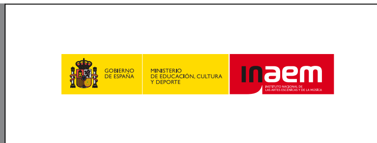
Marca en color para su uso sobre blanco.