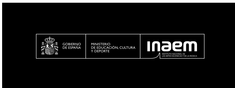
Marca en monocromático para su uso sobre fondos oscuros.