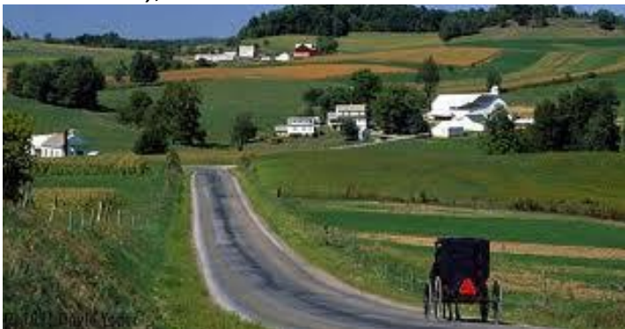
Amish Country, Ohio