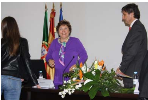
Imagen de la entrega de los Premios Pilar Moreno 2017

Se celebrará una ceremonia de entrega de premios en el Teatro Thalia, de Lisboa, en abril de 2018.