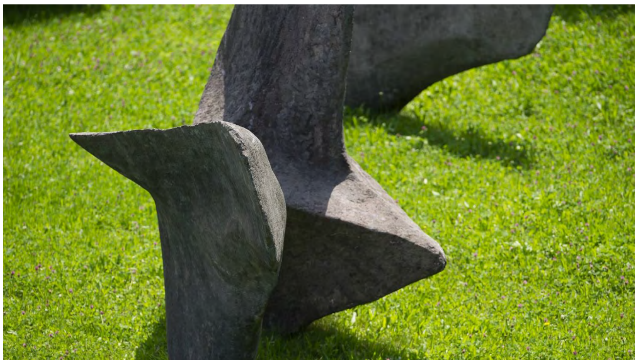
Alicia Penalba: Sin título, 1963, hormigón, 11 partes (Universidad de San Gallen)

13:00 – 13:45 Ottmar Ette (Universidad de Potsdam) iPST: entre la inteligente producción de la estupidez y los laboratorios del futuro. DESPEDIDA Y CIERRE