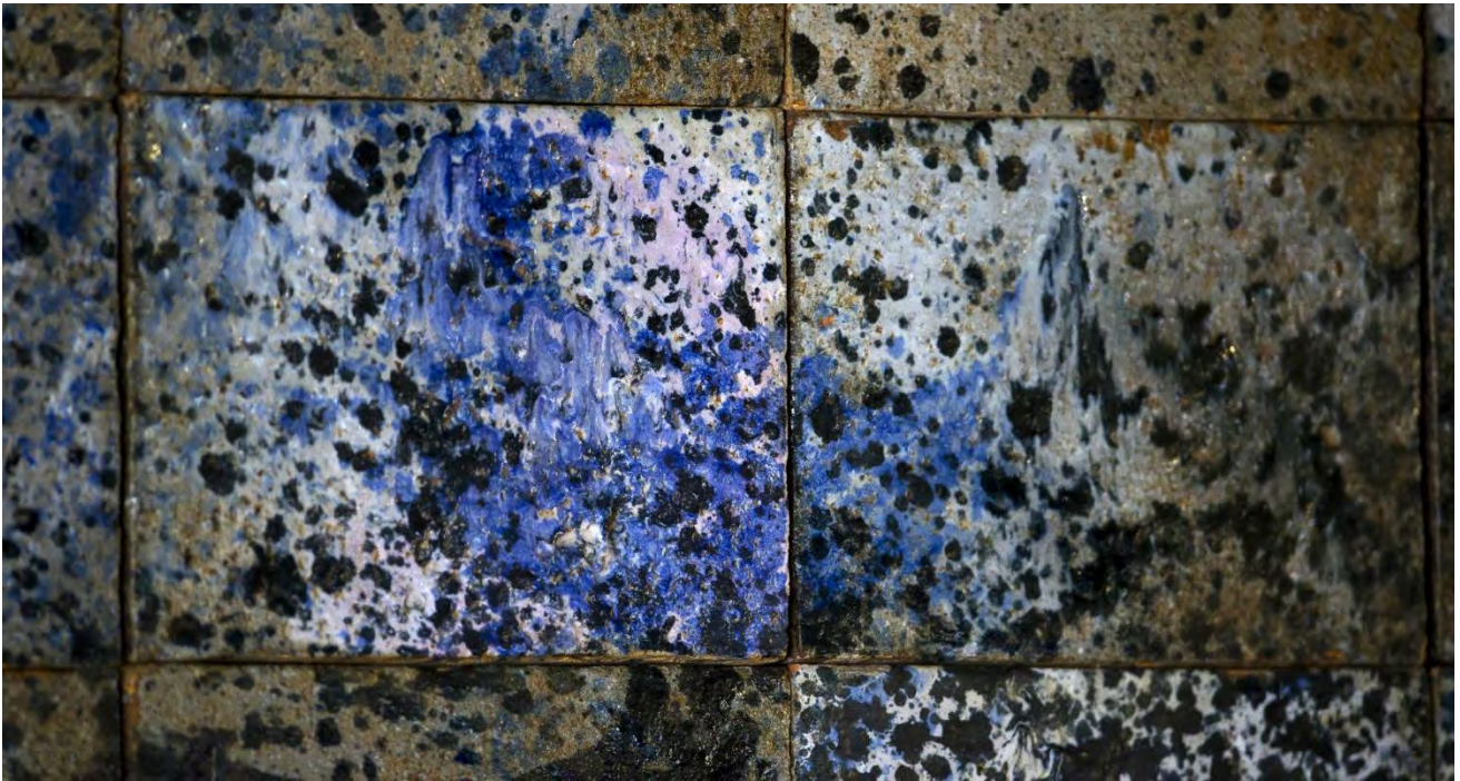
Joan Miró: Sin título, 1964, cerámica (Universidad de San Gallen)

Vivir lo breve: nanofilología y microformatos en obras de arte